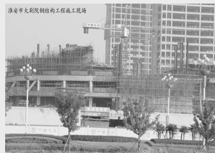
淮安市大剧院钢结构工程施工现场