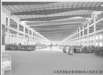
江西景德镇金意陶钢结构工程跨度30M