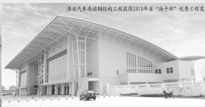
淮安汽车南站钢结构工程获得2010年省“扬子杯”优秀工程奖