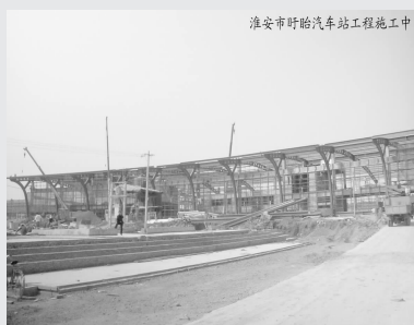
淮安市盱眙汽车站工程施工中