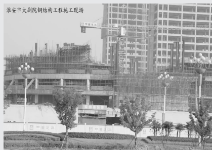
淮安市大剧院钢结构工程施工现场