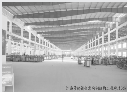
江西景德镇金意陶钢结构工程跨度36M