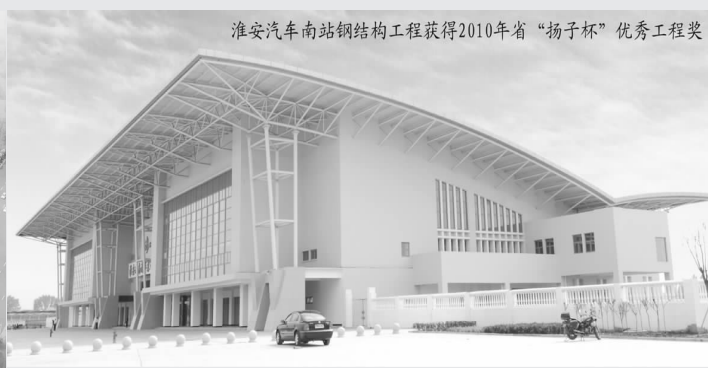
淮安汽车南站钢结构工程获得2010年省“扬子杯”优秀工程奖